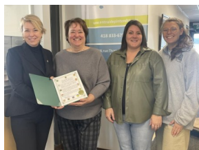
Janvier 2025 : Certificat de reconnaissance, Dominique Viens, députée de Bellechasse-Les Etchemins -Lévis